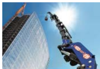
折り曲げブーム式クレーン